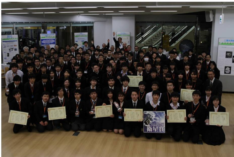
出場者及び選考委員の皆様(於: 幕張テクノガーデン CD 棟2階)

最優秀賞(賞金20万円): ひやけ果 ORANGE(オランジェ) 鳥羽商船高等専門学校 優秀賞(賞金10万円): MIKAN(まじでいいかんじにあまくなる) 鳥羽商船高等専門学校 優秀賞(賞金10万円): 自律型水位観測アレ「長崎オリオンネット」 長崎県立宇久高等学校 選考委員特別賞佐々木嘉和賞(賞金5万円、米国研修旅行): 南国、高知の空の青さを測る! VI 高知工業高等専門学校 選考委員特別賞衛星賞(賞金5万円、衛星オペレーション見学会): 飛べないたこはただのタコ〜凧を用いた大気状況の観測と分析〜 早稲田実業学校高等部 代表理事特別賞(賞金5万円): 視程観測機"Clear Sky" 東京都立立川高等学校 観客賞(賞金5万円): 流星出現通知システム 中央大学附属中学校・高等学校 観客賞(賞金5万円): 海流観測・海底探索システム「魚ローン」 長崎県立宇久高等学校